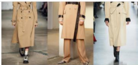
Gabardina a dos tonos en la colección de Monse, Sportmax y Jonathan Simkhai.

En materia de abrigos, la gabardina a dos tonos se perfila como una de las tendencias más relevantes de los meses otoñales. Monse, Tod's y Victoria Beckham se inclinaron por una estética que nos propone distanciarnos ligeramente del trench tradicional, pero sin dejar de atesorar en nuestro clóset un atuendo elegante.