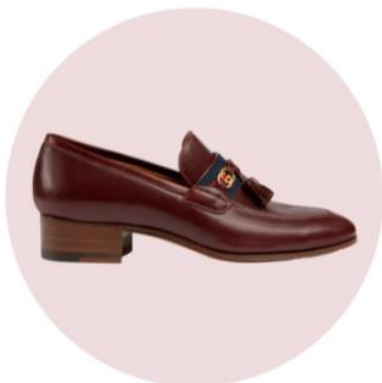
Mocasines firmados por Gucci.

Un diminuto tacón cuadrado no le hace daño a nadie, es más, prácticamente no se siente al caminar, eleva tus piernas y las estiliza. Cuando se trata de mocasines , esa es la propuesta de tacón de varias casas de moda, con diseños retro que nos transportan a los años setenta con facilidad (hay más de un par de este estilo de zapatos en el clóset de mi abuela). No obstante, ahora los llevamos con calcetas (pueden ser transparentes o blancas), en fusión con jeans y hasta faldas midi. La unión de dos eras nunca se había visto tan bien.