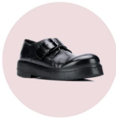
Mocasines firmados por Marsell.

Aquí entramos en terreno peligroso y controversial. Los zapatos que son deliberadamente 'feos' son algo que escandalizaría a Audrey Hepburn, pero han fascinado a más de una al navegar contra la corriente de todo lo que se considera estético. A primera vista, el 'NO' puede ser rotundo, pero cuando comienzas a imaginar cómo se verían con unos jeans rectos con el ruedo al tobillo, o con unos pantalones capri, la perspectiva comienza a cambiar hasta que terminas haciéndote de un par.