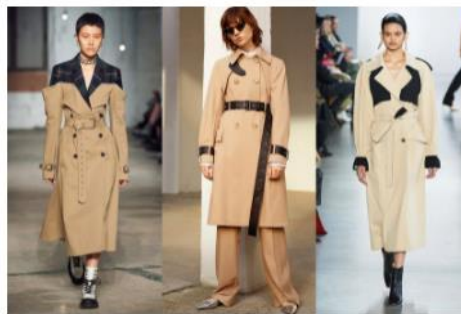
Gabardina a dos tonos en la colección de Monse, Sportmax y Jonathan Simkhai.