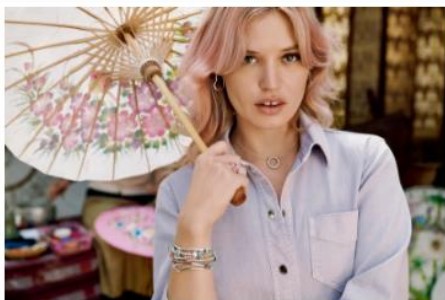
Un collar clásico para todos los días.