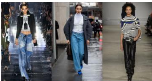
Jeans a la cadera en la pasarela de Tom Ford, street style y Zadig & Voltaire. DANIELE OBERRAUCH / GORUNWAY.COM