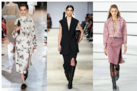
Falda con abertura en la pasarela de Altuzarra, Jil Sander y Chanel.

La falda con abertura se labra camino a través de las piezas más sensuales del otoño 2020 , en diseños confeccionados en tejido de punto, con agregado de plumas, ornamentada por delicados estampados florales o revestida con los clásicos pliegues. Las combinaciones que se pueden crear a partir de su impronta son infinitas, pero...¿por qué no sustituir las botas de montar o los flats con unos tenis en tendencia?