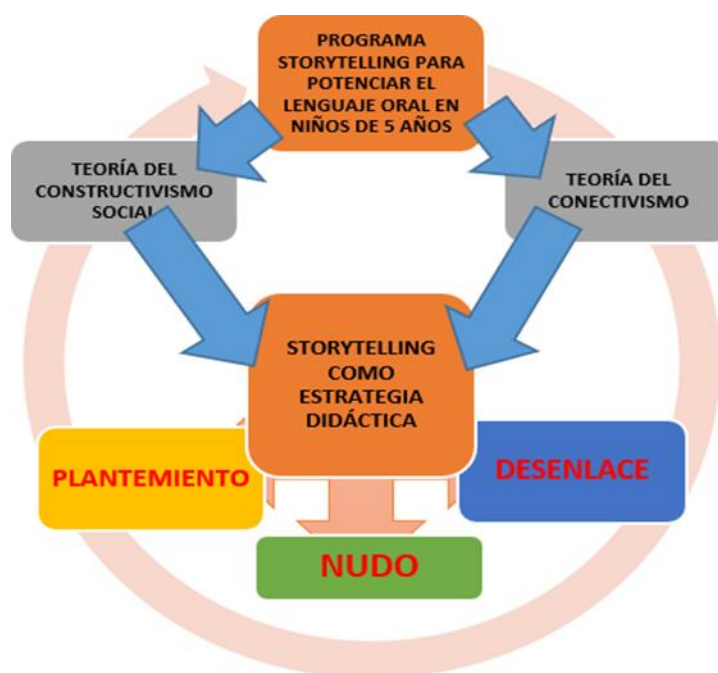
Figura 1: Modelo teórico de la propuesta “Programa Storytelling digital”

R2: Programa storytelling para fortalecer el lenguaje oral en niños de cinco años