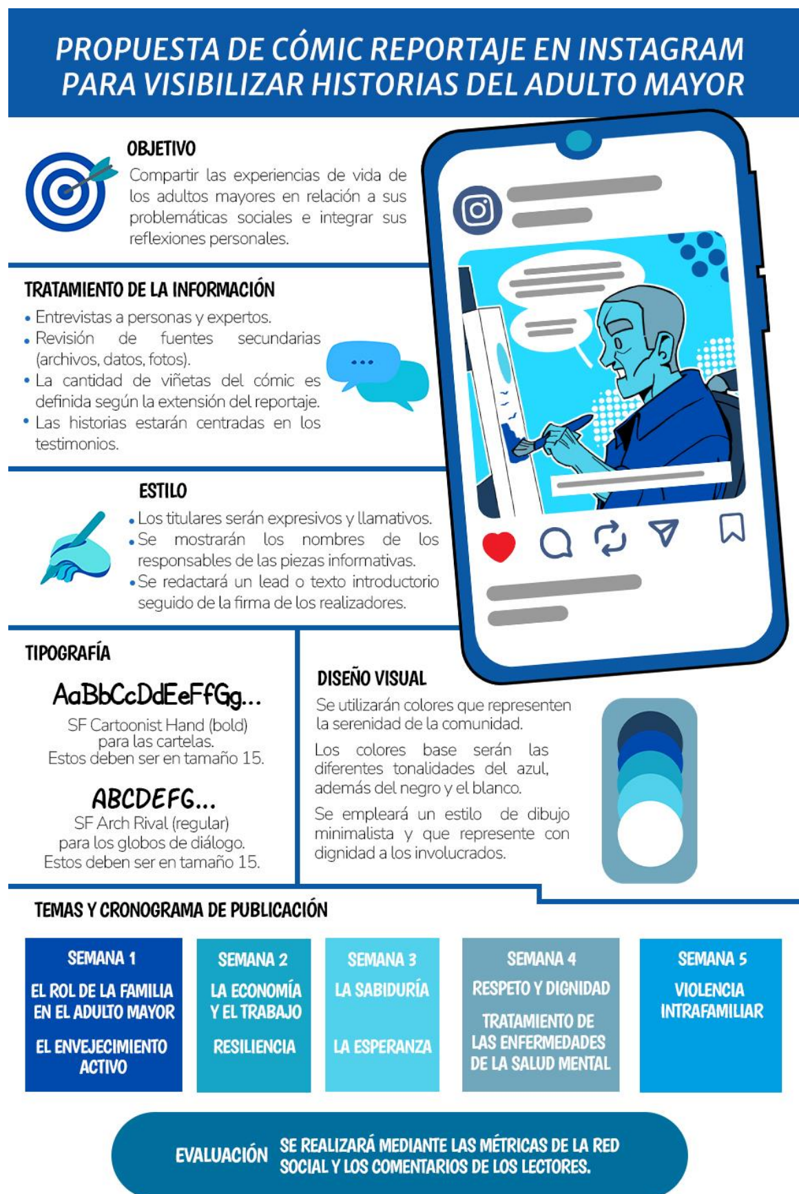
Figura 7 Infografía de la propuesta