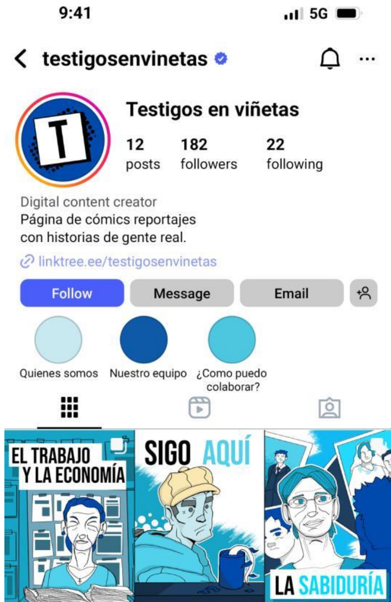
Figura 10 Diseño de la cuenta en Instagram