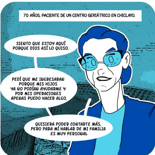
70 AÑOS, PACIENTE DE UN CENTRO GERIÁTRICO EN CHICLAYO.

A VECES, SON ELLOS MISMOS LOS QUE SE PRESENTAN CUANDO SE SIENTEN MALTRATADOS.