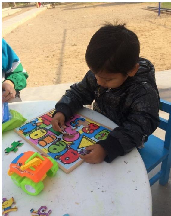
INTERACCION ESPONTÁNEA DURANTE LA PRUEBA