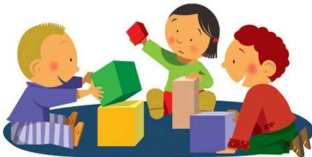
Figura 1. Creación propia