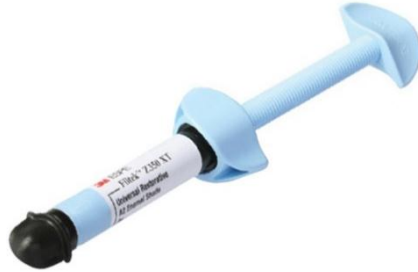
Figura 1. Resina Filtek Z350 3M-ESPE