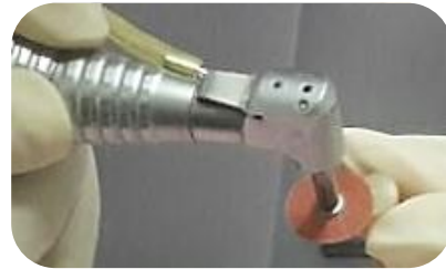
Figura 8. Uso del sistema Soflex