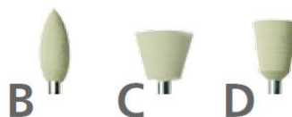
IMAGEN 1: Selección de formas de Politip (Ivoclar-Vivadent).

Pulidores verdes: tamaño de grano fino para un pulido de alto brillo. 15