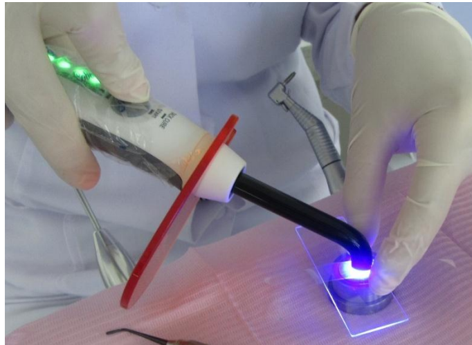
Figura 2. Fotopolimerización de la resina