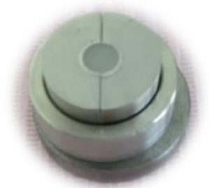
Figura 3. Cilindro de metal estandarizado