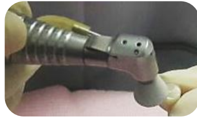
Figura 6. Uso del sistema Politip