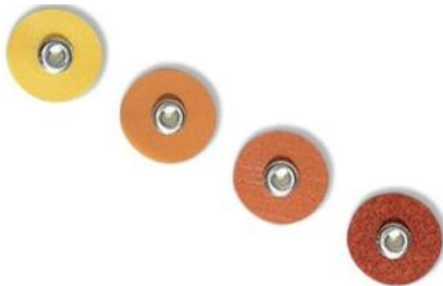
Figura 7. Sistema de Pulido Discos Soflex