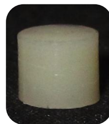
Figura 4. Especimen de resina