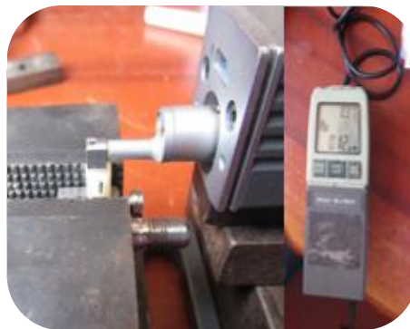
Figura 9. Medición de la rugosidad superficial del espécimen