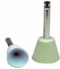
Figura 5. Sistema de pulido Politip