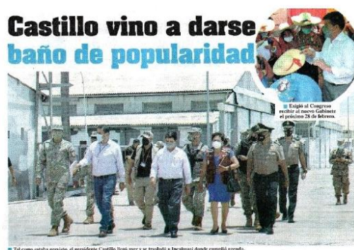
Fotografía n.º 4