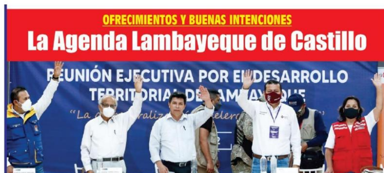
Fotografía n.º 7