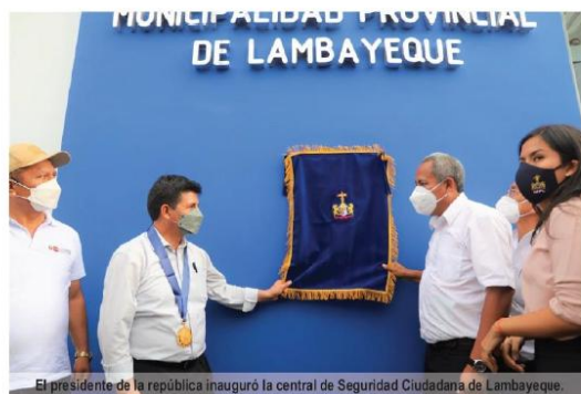
Fotografía n.º 12