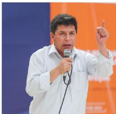
Pedro Castillo dijo que no tenía una varita mágica.