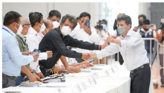
El mandatario dejó claro que no tenía la "varita mágica" para atender todos los reclamos.