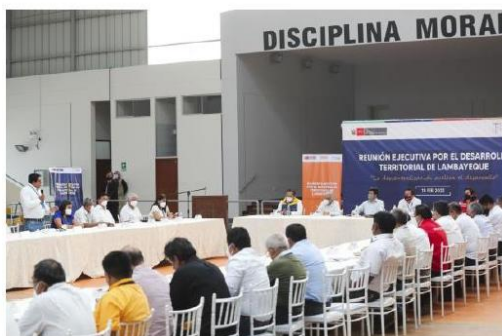
Los alcaldes presentaron una larga lista de pedidos.