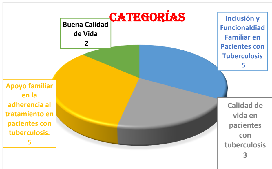
Gráfico N° 04: Clasificación de artículos seleccionados, según categorías identificadas