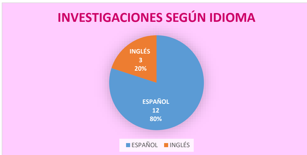
Gráfico N° 03: Clasificación de artículos seleccionados, según idioma

Del 100% de estudios revisados, según el idioma de las publicaciones: Correspondió a español el 80 % (12) artículos ( 8,13,14,15,16,17,18,20,21,22,23,26 ), inglés al 20% (3) artículos ( 19,24,25 ). Como se muestra en el gráfico N° 03: