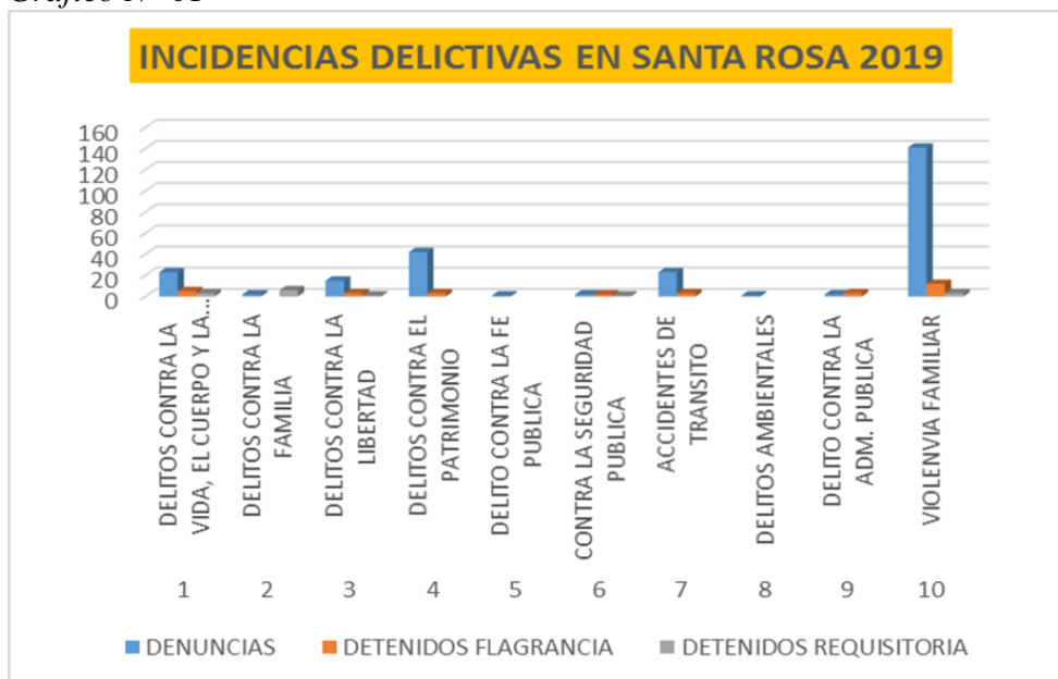
Grafico N° 01

Se tiene certeza que los actores principales (PNP, Rondas campesinas juntas vecinales y diferentes representantes sociales) y la ciudadanía tienen conocimiento de las principales amenazas en seguridad ciudadana que vienen afectando al distrito de Santa Rosa, por ello se evidencia que los hurtos se dan en ciudades de mayor población un 22% indica que ha sido víctima por este delito, con un 17% hogares donde recibieron agresiones físicas o verbales (violencia física o psicológica), finalmente con 5,2% de los hogares que declararon ser víctima de otro tipo de delito según los hallazgos encontrados por Mariaca, (2017).