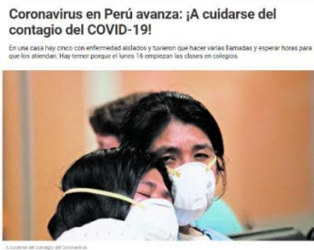
A lo largo del tiempo del coronavirus

Coronavirus en Perú avanza: ¡A cuidarse del contagio del COVID-19! En una casa hay cinco con enfermedad aislados y tuvieron que hacer varias llamadas y esperar horas para que los atiendan. Hay temor porque el lunes 16 empiezan las clases en colegios.