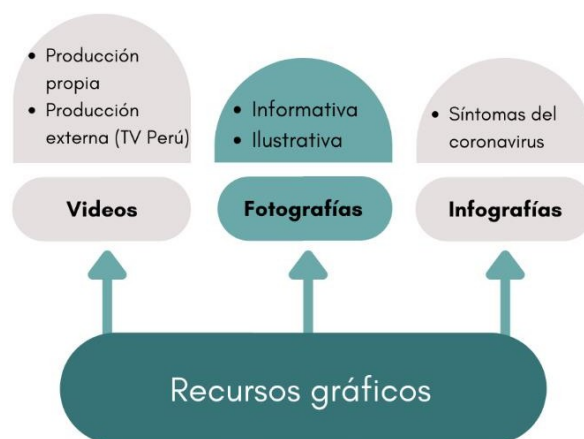
Figura 4 Uso de recursos gráficos de las noticias.

Los resultados reflejaron que los recursos gráficos más utilizados fueron las fotografías ilustrativas, las cuales no dieron a conocer datos específicos. Su objetivo fue meramente llamarla atención de la audiencia y romper con la monotonía del texto. Estas fotografías hicieron referencia a mujeres en primer plano usando mascarillas en lugares públicos, al personal de salud en planos generales transportando a víctimas, y a personajes públicos dentro del contexto de la pandemia. Con respecto a las leyendas, cabe resaltar que estas replicaron con exactitud el título de la noticia.