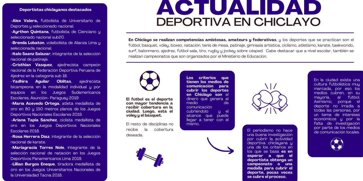
Figura 1. Infografía de la actualidad deportiva en Chiclayo

No, porque existe una cultura futbolística muy marcada y las otras disciplinas quedan relegadas. Asimismo, porque el deporte no irradia a todas las personas, por un tema de intereses económicos y por la falta de investigación por parte de los medios de comunicación locales.