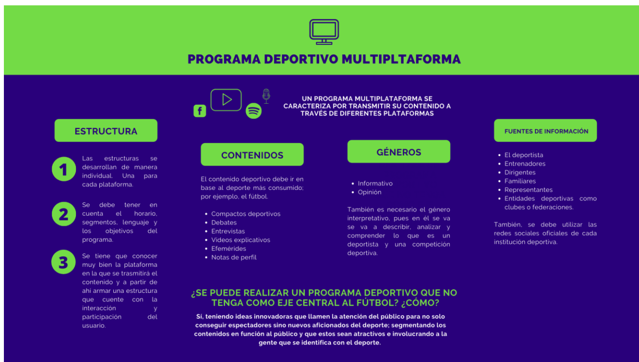
Figura 2. Infografía de un programa deportivo multiplataforma

Un programa deportivo multiplataforma se puede financiar con auspiciadores, alianzas con municipalidades y colegios de Chiclayo. También, entregando contenido exclusivo a los usuarios por medio de la suscripción.