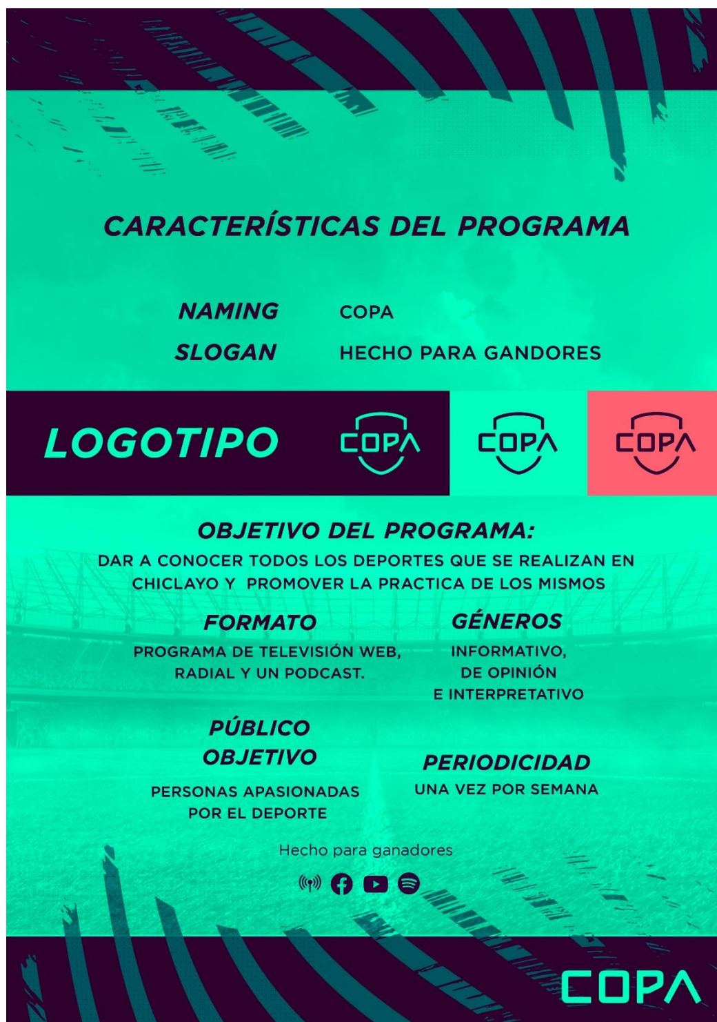
Figura 3. Características del programa