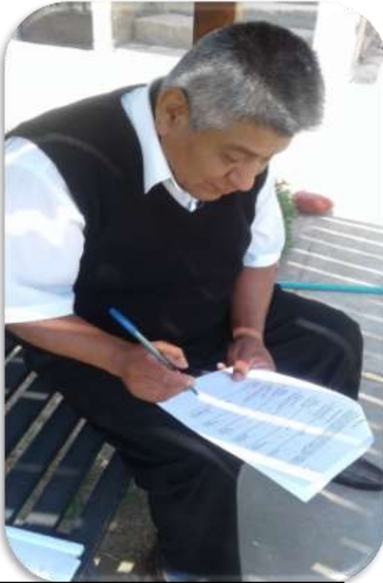
Docentes desarrollando el PIL