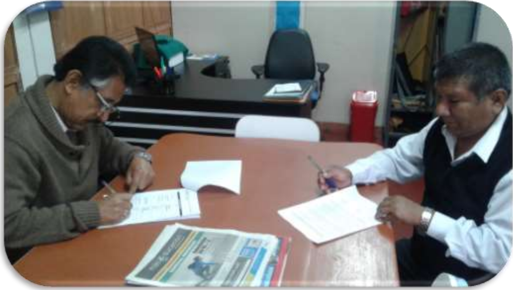
Docentes desarrollando el PIL