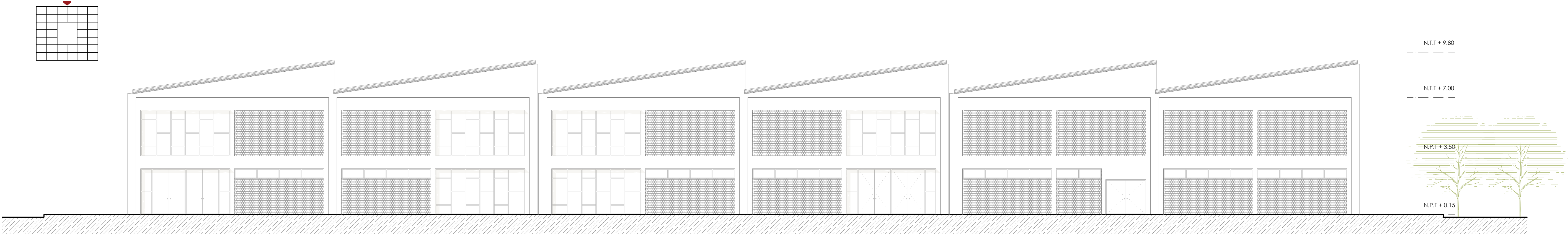
ELEVACIÓN OESTE ESC 1/125