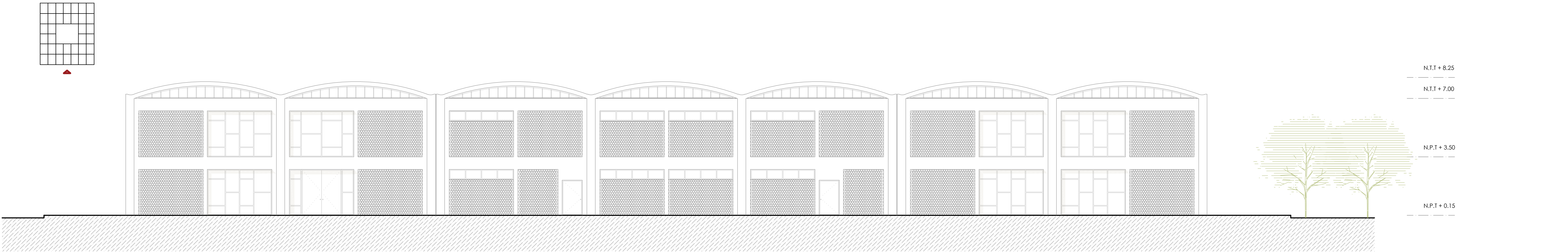
ELEVACIÓN SUR ESC 1/125