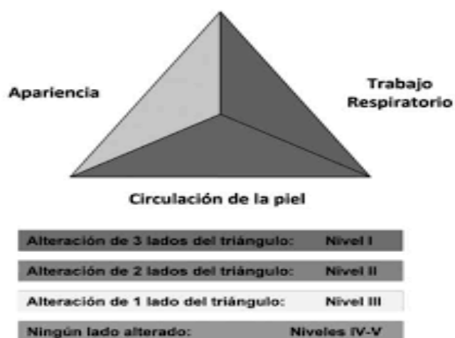
Figura 1: Nivel de prioridades según los lados del Triángulo

Con esta simple valoración en la que no se deben invertir más allá de 30-60'' se consigue clasificar al paciente en estable o inestable, en función del número de lados del triángulo que estén alterados y tener una primera aproximación del nivel de gravedad, así como del problema principal del mismo 4 , tal como se observa en la siguiente figura (Figura 1).