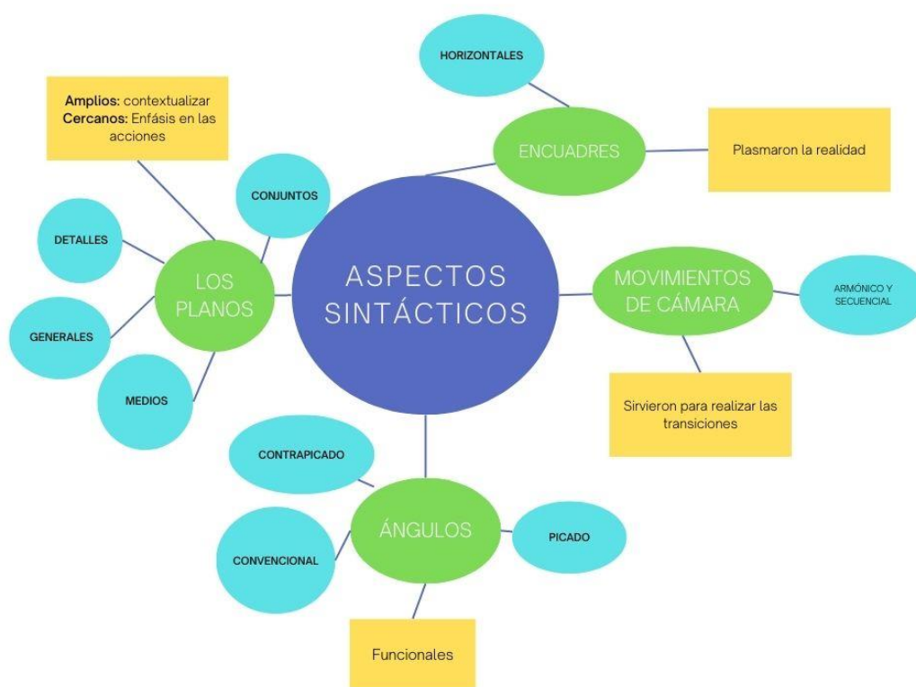
Figura 01: Aspectos sintácticos de los spots

Por otro lado, los expertos mencionaron que los movimientos de cámara fueron importantes para realizar transiciones para poder saltar a otra realidad de forma ágil sin confundir al espectador. Por tanto, mediante estas transiciones se mostraron acciones y con ella sus consecuencias, lo cual permitieron que los spots comuniquen mensajes de prevención y también de alerta.