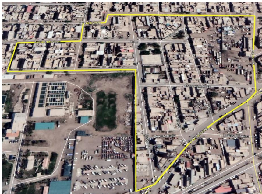
Figura N°2: Zona de estudio

Nuestra zona de estudio es el pueblo joven Las Mercedes – José Leonardo Ortiz, el cual cuenta con un área de 7.60 hec. Su población es de 5134, según el INEL. En este lugar encontramos un gran comercio ambulatorio, servicios de mototaxis y recicladoras. Además, por la gran afluencia de los paraderos aledaños, lo convirtió en un lugar más concurrido, tanto así que encontramos varios restaurantes en la calle Tarapacá y algunos carros que hacen servicios de transporte hacia Cayalti.