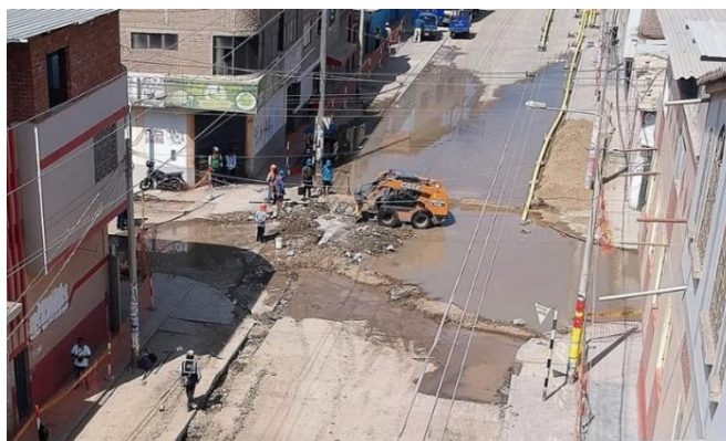
Figura N°1. Tubería de agua rota