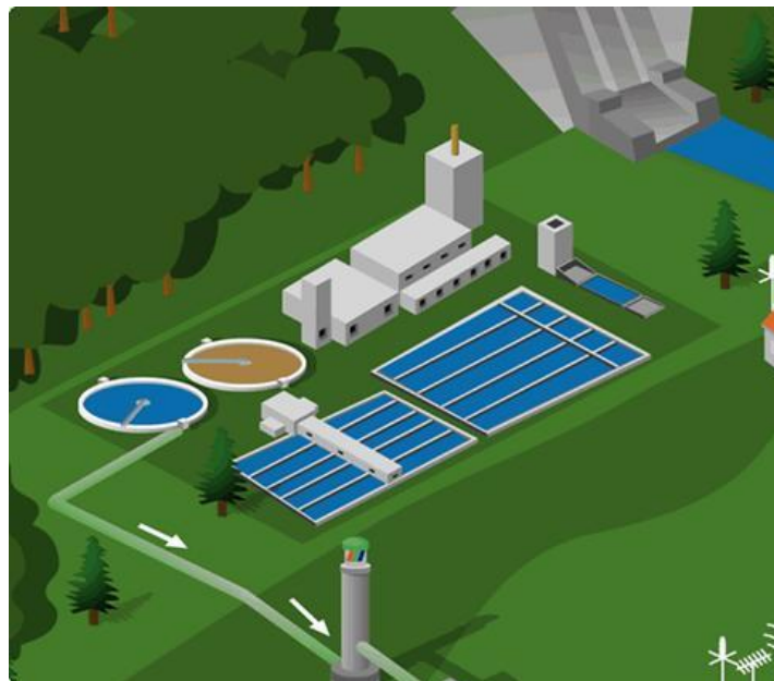
Figura N°3. Sistema de abastecimiento de de agua potable