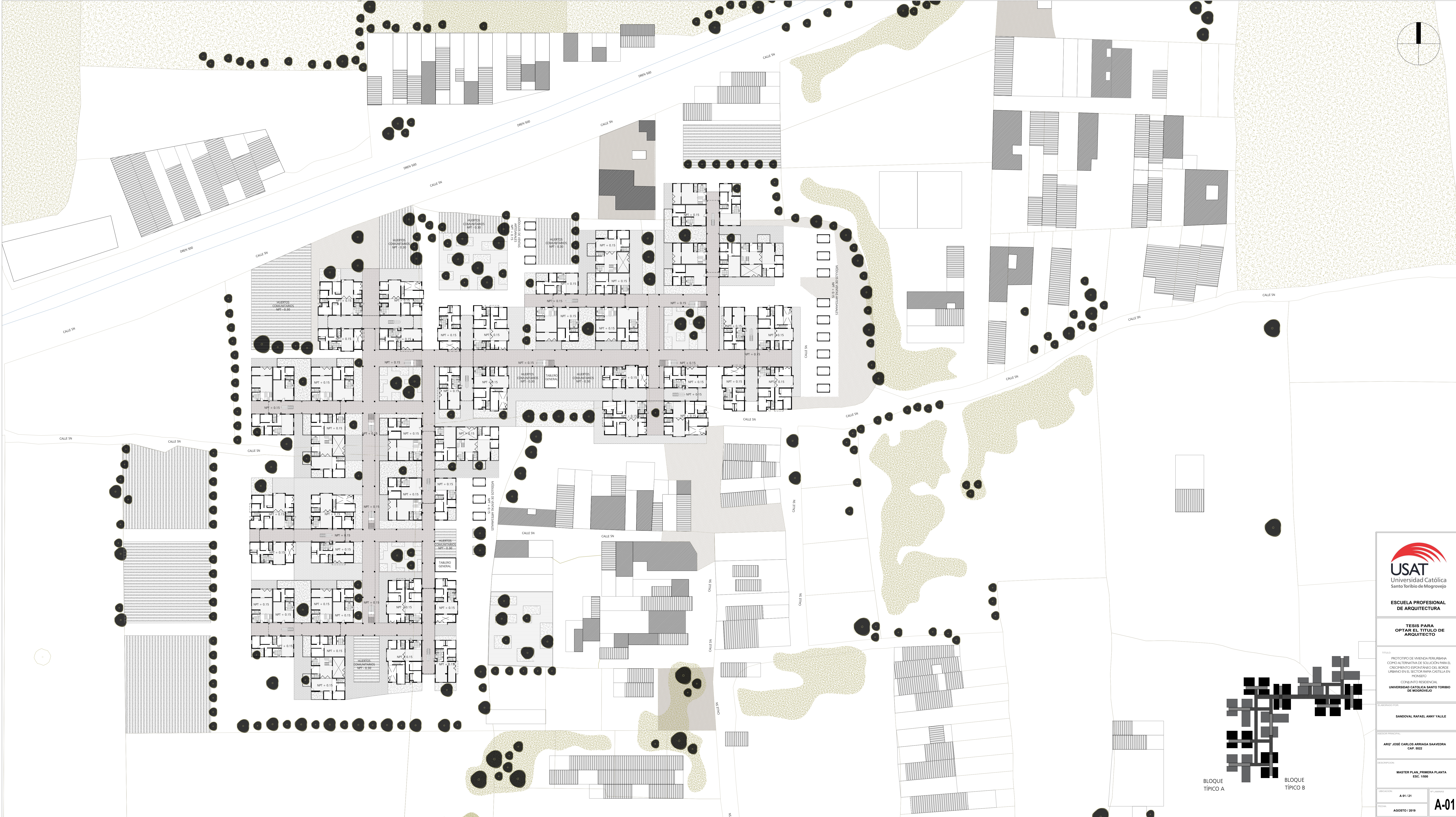
BLOQUE TÍPICO A