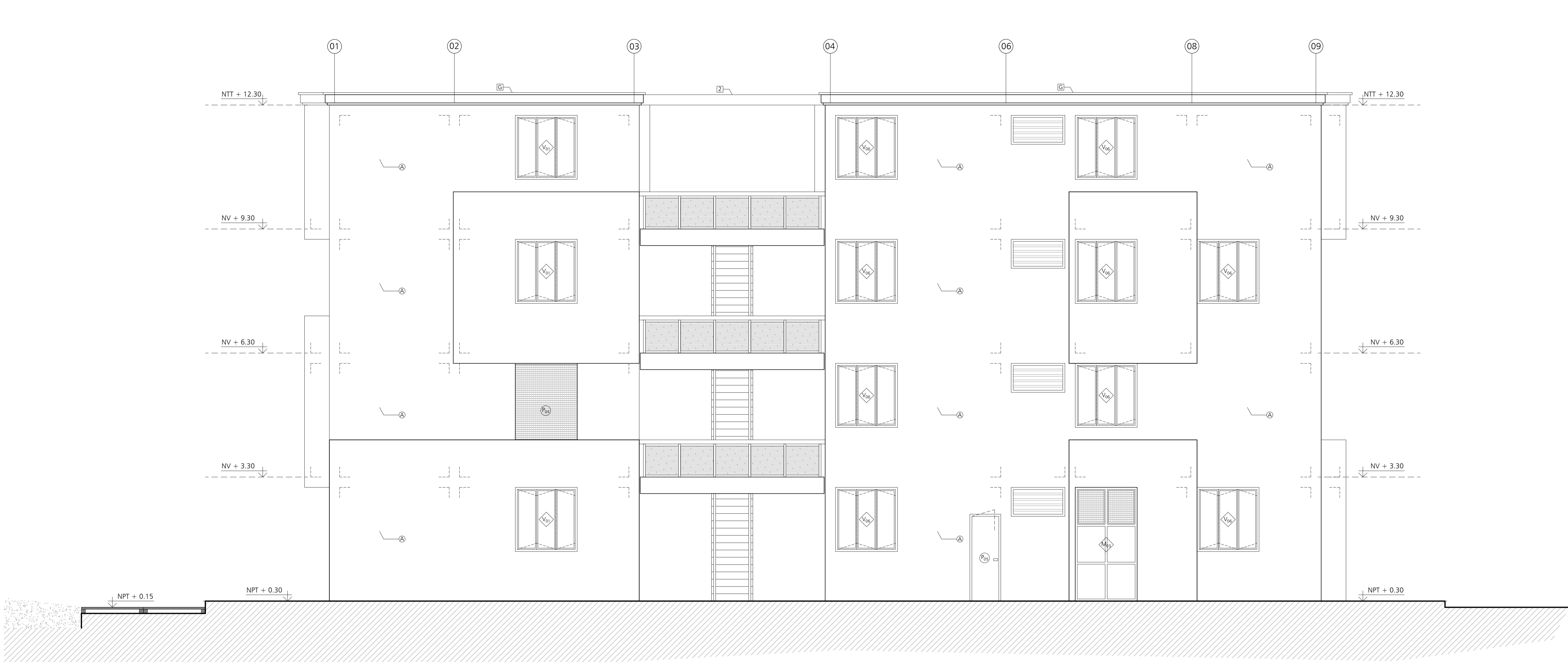
A ELEVACIÓN D-D' Escala 1/50