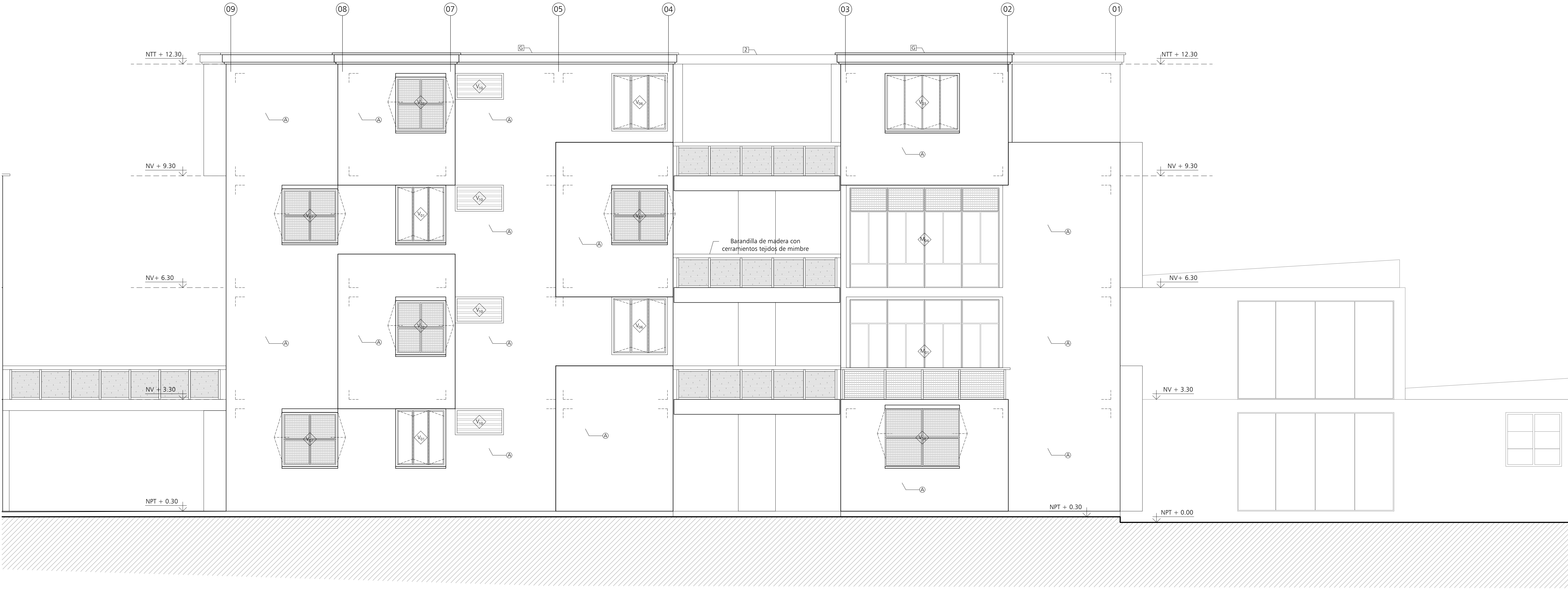
A ELEVACIÓN A-A'