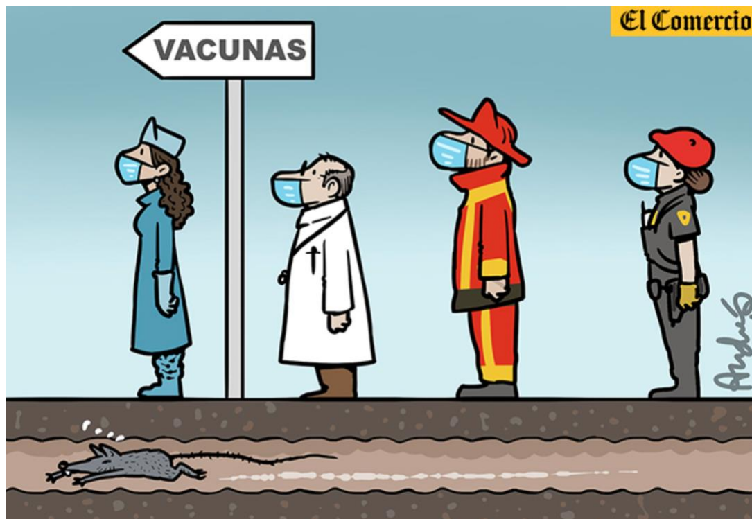
Título: Por lo bajo Fecha: 16 de febrero del 2021