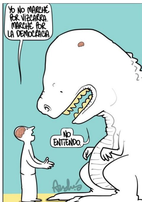
Título: En simple. Fecha: 20 de febrero del 2021