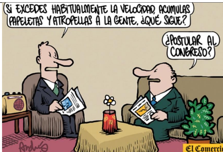
Caricatura Nro. 2