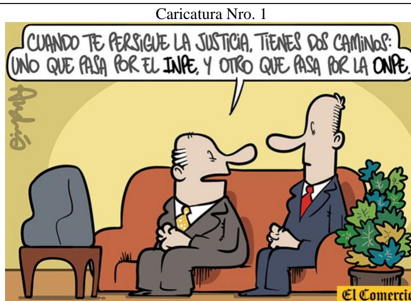
Título: La bifurcación Fecha: 12 de enero del 2021