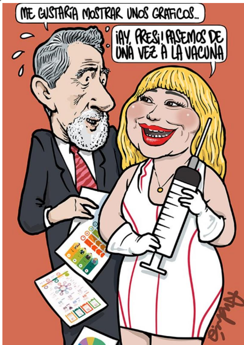
Título: Sin preámbulos Fecha: 23 de enero del 2021