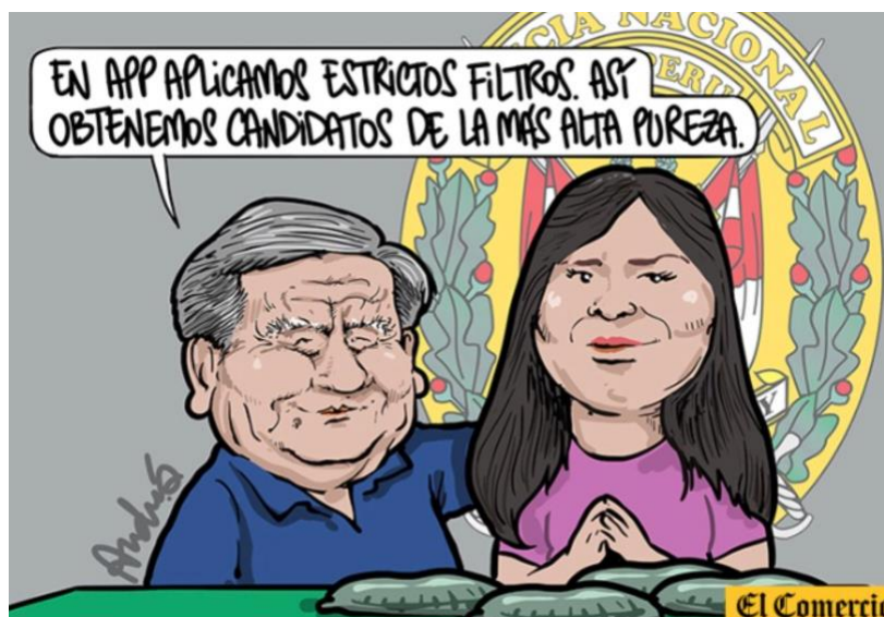
Título: La pura purita Fecha: 25 de enero del 2021