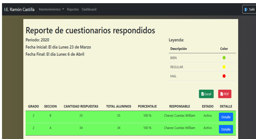
Fig. 3. Ejemplo de interfaz realizada

Las interfaces se realizaron considerando los requerimientos funcionales identificados en el levantamiento de información donde participaron docentes y alumnos del colegio de estudio para que el usuario final se adapte rápidamente al sistema y que este último no presente complicaciones al momento de ser usado.