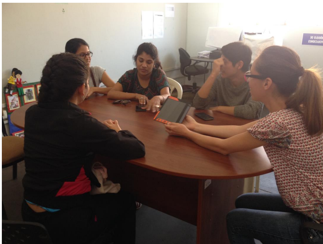
Focus group aplicado a los estudiantes de la Escuela de Comunicación- USAT