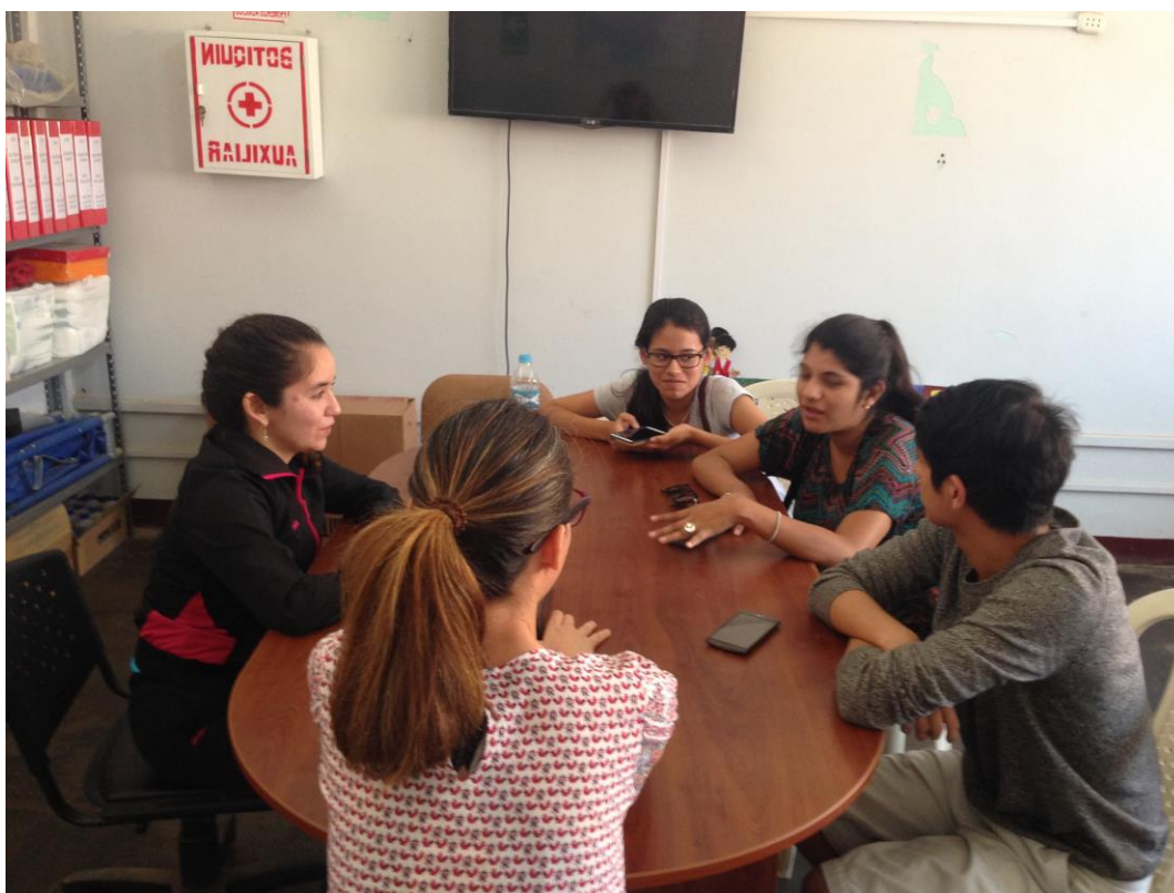
Los participantes compartieron sus puntos de vista y mostraron interés en el tema.