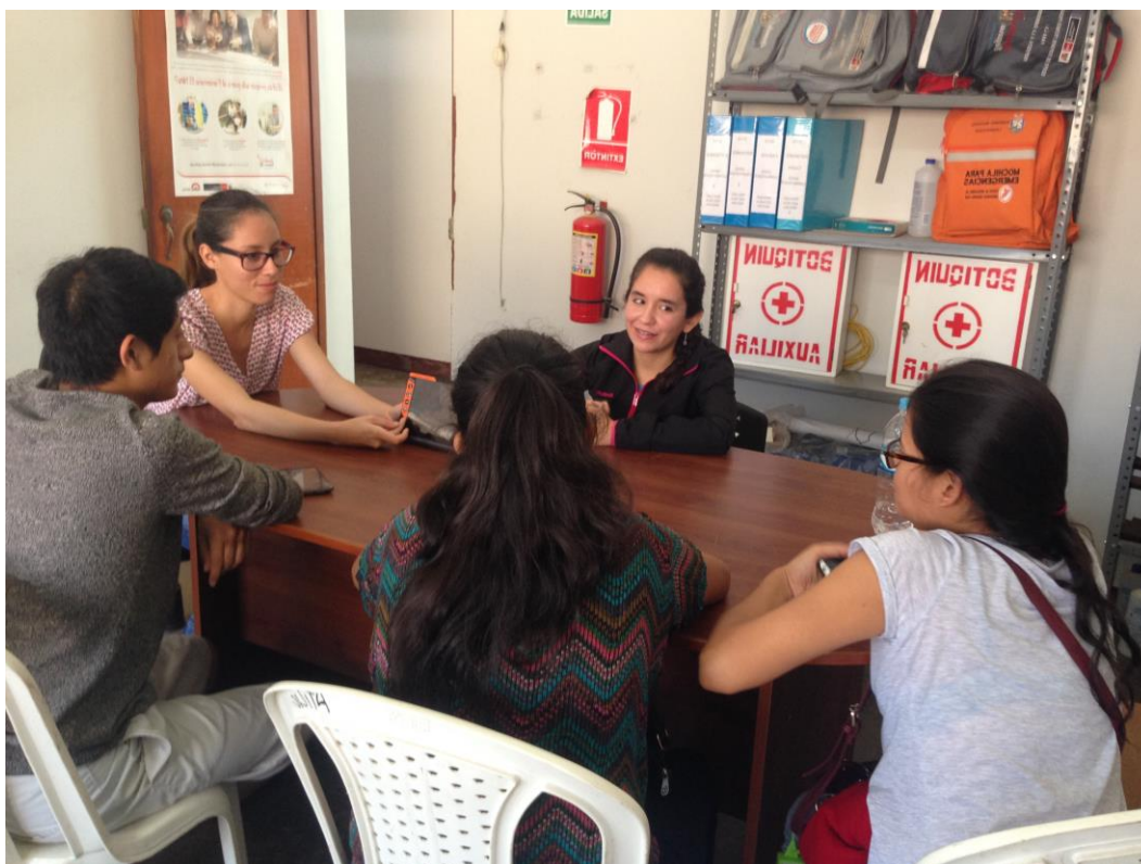
El Focus group se inició a las 10 A.M. del día 12 de noviembre de 2016