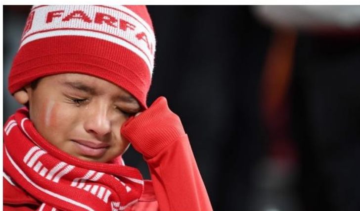
La desilusión. Las nuevas generaciones solo conocían el triunfo. Este aterrizaje servirá para despegar vuelo nuevamente.

Nos faltó gol, nos sobró sentimiento. La gesta mundialista en Rusia 2018 fue una travesía emocional que debe servir para refundar el fútbol peruano. Una crónica moscovita