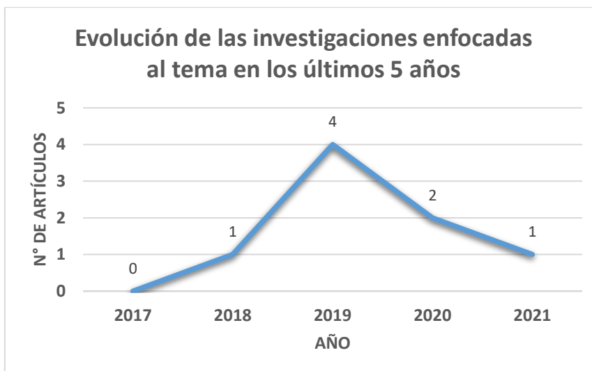
Gráfico 2: Evolución del tema en los últimos 5 años