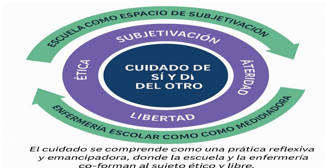
Figura 2. Modelo explicativo del cuidado de sí y del otro como fundamento ético y educativo del cuidado enfermero

El cuidado de sí y del otro se configura como una práctica ética y educativa en la que el sujeto, mediado por la escuela y la enfermería, se transforma a través de la experiencia. En este proceso, el cuidado deja de ser una técnica o norma para convertirse en una forma de libertad responsable, fundamento del cuidado enfermero humanizado.