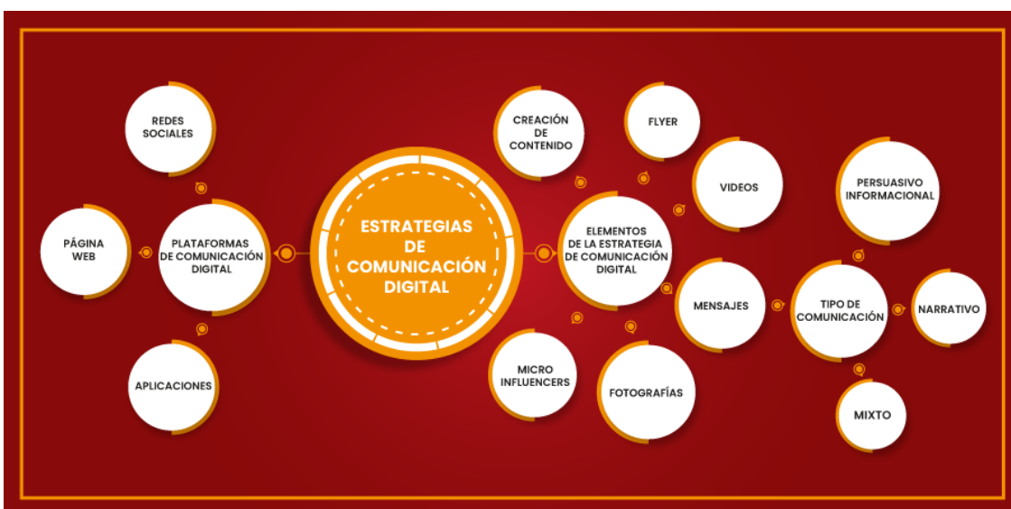
Estrategias de comunicación digital