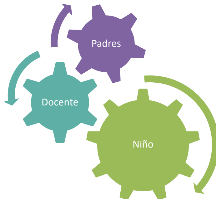
Figura que explica la cooperación educativa que se realiza entre padres y docente repercutiendo en una formación idónea de los niños.