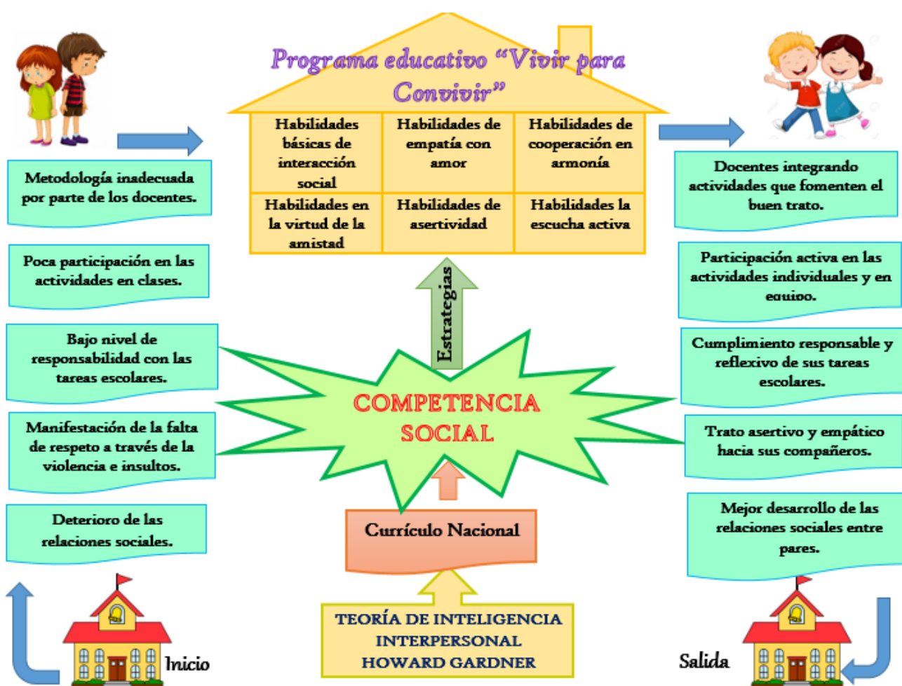
Figura 1: Elaboración propia.

El programa educativo consta de 12 talleres, los cuales deben desarrollarse 2 veces por semana, la metodología empleada es activa y participativa la cual conduce a desarrollar la competencia social en los niños y niñas de quinto grado de Educación Primaria, propiciando la construcción de sus aprendizajes sociales por medio de estrategias que sean llamativas y motivadoras que despierten su interés, así mismo el agregado tecnológico en cada uno de los talleres, lo cual ayudará a conseguir los objetivos propuestos. Por otro lado, el docente tendrá como función principal generar situaciones propicias para la reflexión y cambio de conductas favorables para la integración a la sociedad, cuyo logro se podrá observar en las