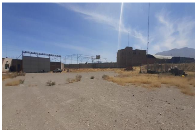
Figura A- 2: Localización del local industrial Rio Seco