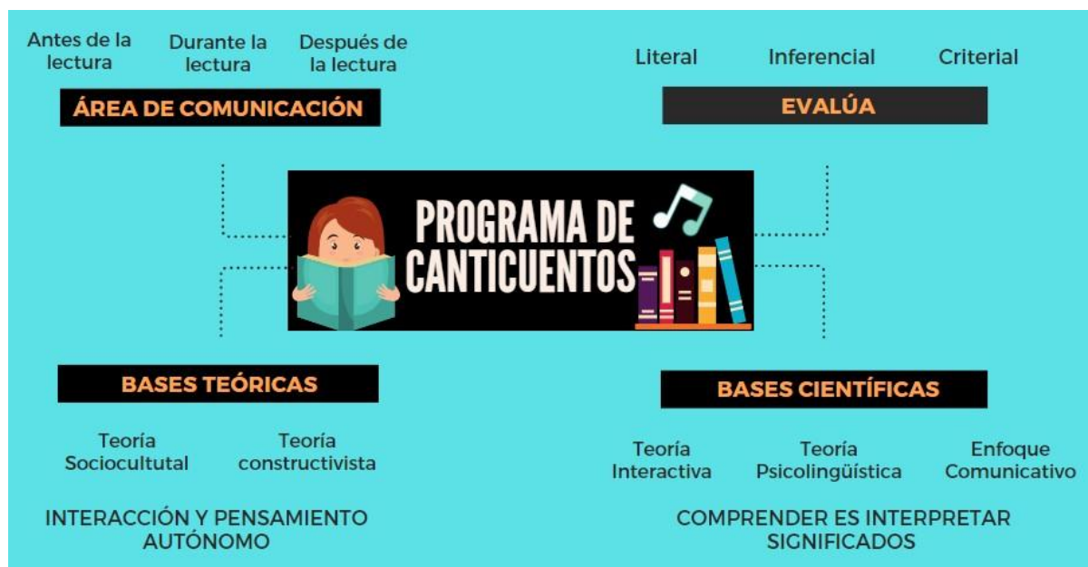
Figura 3. Modelo teórico gráfico de la propuesta

El programa consta de veinte actividades diseñadas bajo el proceso didáctico del área de comunicación cuya finalidad es fortalecer la comprensión de textos en sus tres niveles, literal, inferencial y criterial, así mismo, fue evaluada mediante una guía denominada juicio de expertos, obteniendo como valoración final un 96%, lo cual, quiere decir que se ubica en el nivel muy alto, apta para su aplicación.