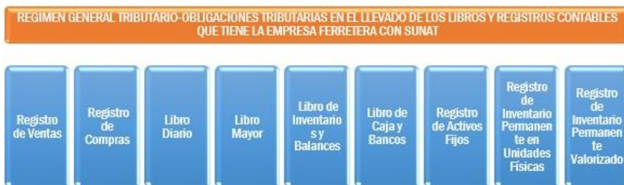
Figura N° 2. Libros y/o registros contables

En cuanto a los registros contables las empresas pueden llevarlo de manera electrónica, manual o computarizada usando el cronograma establecido por la administración. Actualmente la empresa, lleva de manera electrónica el Registro contables y Libro diario, libro mayor y libro de inventarios y balances entre otros, lo lleva en formato físico.