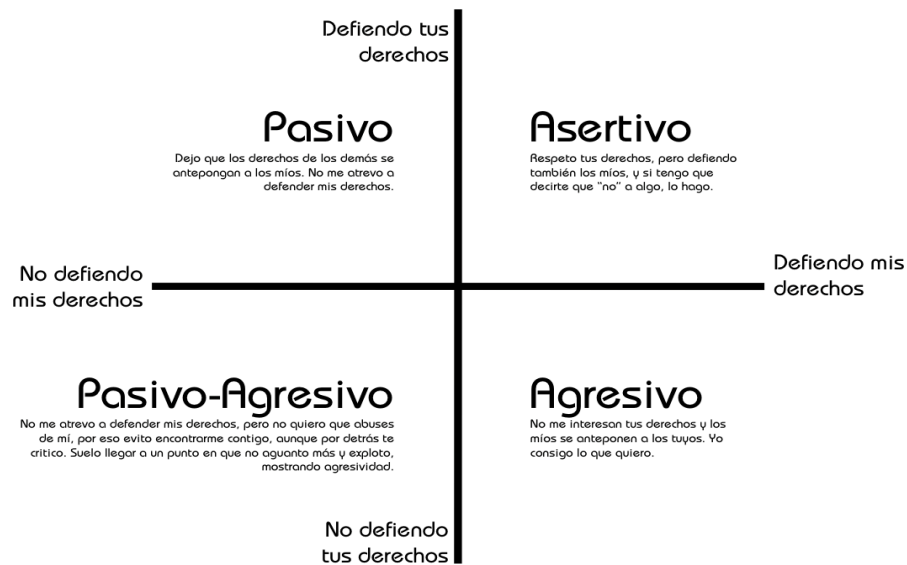
Tabla N° 02 Estilos de comunicación 258

El estilo de comunicación puede facilitar o dificultar las relaciones en la familia; ayudará o entorpecerá la comunicación; como resultado se dará un buen vínculo familiar o un defectuoso vínculo en la formación de las personas 259 . Un adecuado estilo de comunicación es necesario para que la relación de los cónyuges se edifique cada día y para que los padres se comuniquen asertivamente con los hijos en las diversas etapas de la vida.