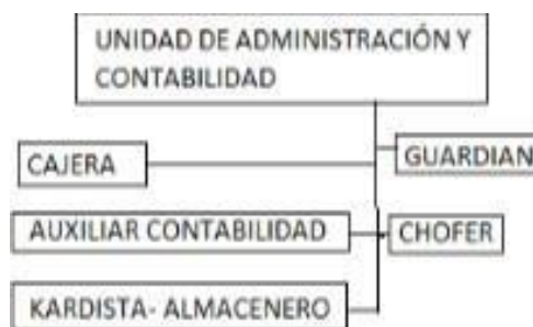
Figura N°02: Organigrama de la Unidad de Administración y Contabilidad