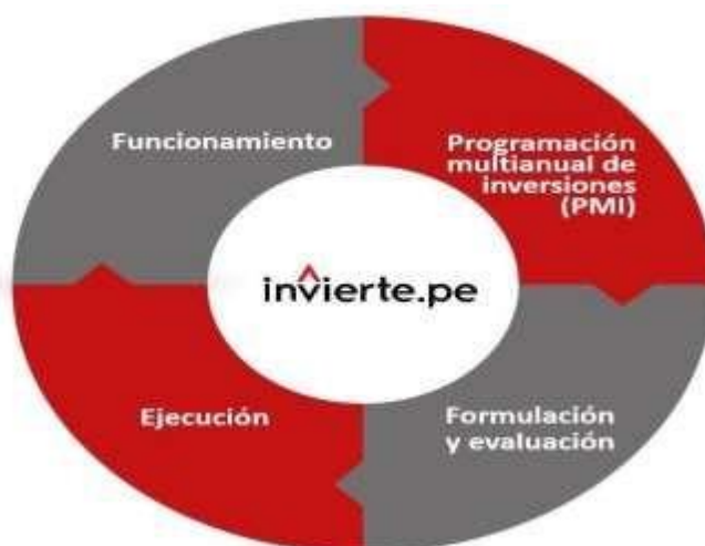
Gráfico 1 – Ciclo del proyecto

De corresponder, se podrán efectuar diversos tipos de intervención para un mismo recurso turístico, tales como: ampliación y mejoramiento o ampliación, mejoramiento y recuperación de servicios turísticos públicos en el recurso turístico.