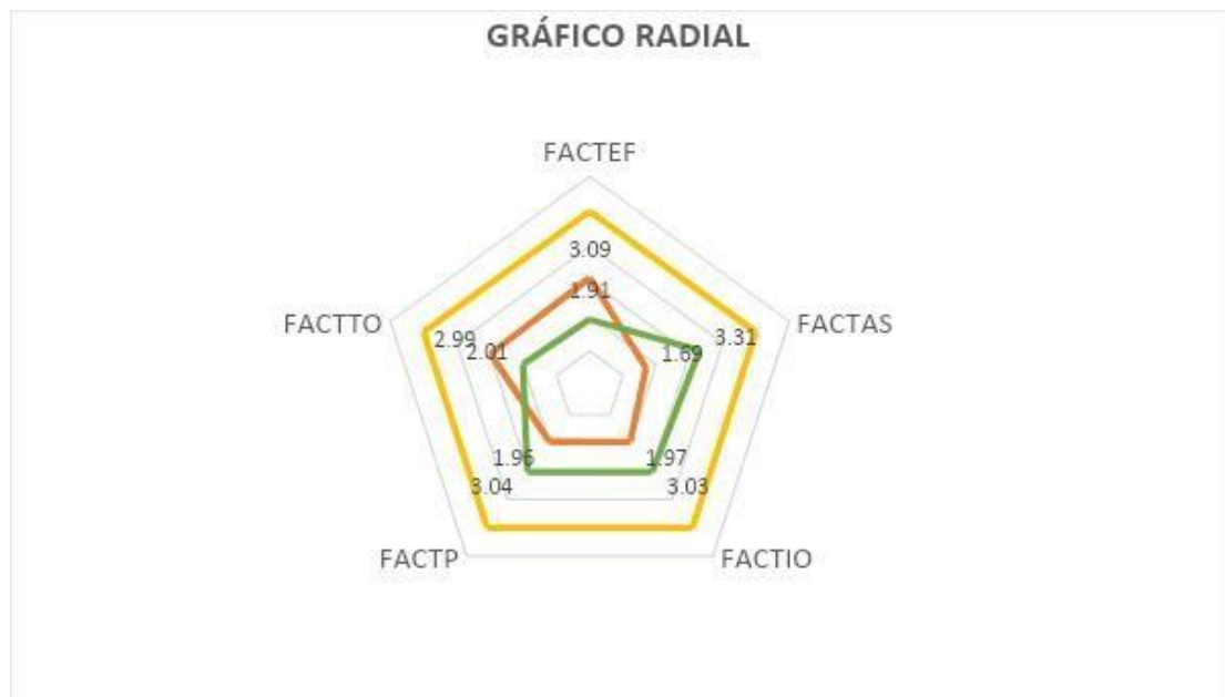
Figura 2. Gráfico Radial

Se realizó un gráfico radial como método estadístico, para llegar al objetivo general qué es determinar cuál de las dimensiones están más lejos de la situación ideal, que en este caso sería la formalización de los recicladores.