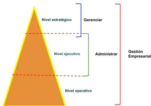
Figura 1 Niveles organizativos dentro de las empresas

Nota. Tomado de Importancia del modelo de gestión empresarial para las organizaciones modernas , por P. Julio, 2020, Enfoques