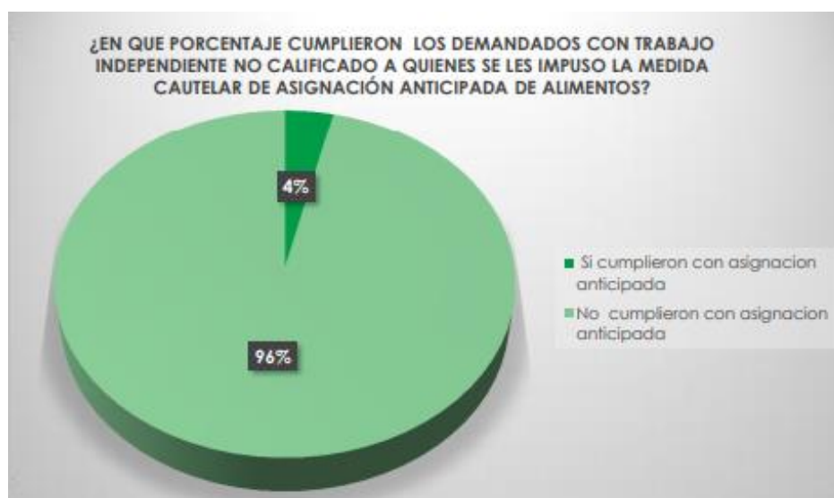
GRÁFICO 2. Porcentaje de cumplimiento de la asignación anticipada de alimentos de los demandados con trabajo independiente no calificado.