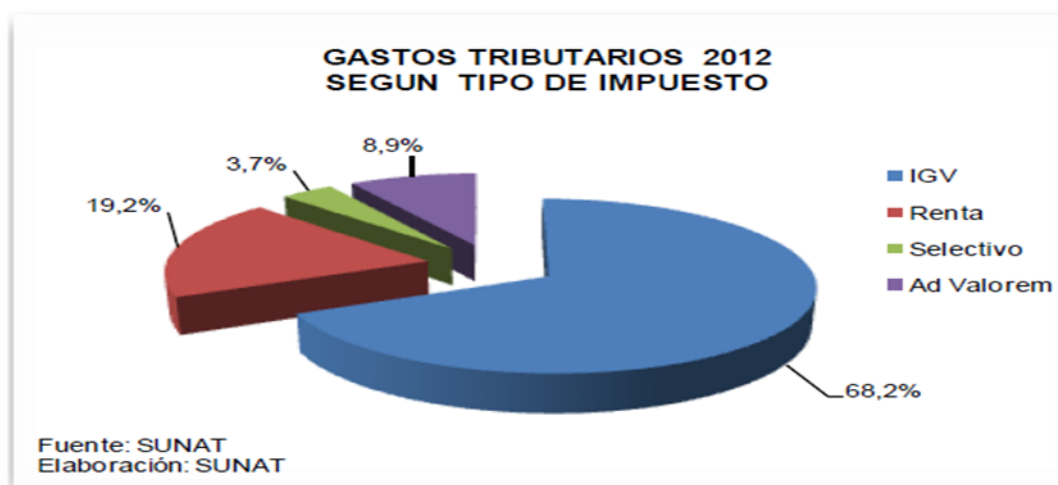
Figura 1 : Gastos tributarios 2012 según tipo de impuestos

Superintendencia Nacional de Administración Tributaria –SUNAT (2011), comenta que el IGV es el impuesto que concentra los mayores importes de gastos tributarios estimados para el 2012 (68%), tributo a través del cual se asignarían S/. 6 845 millones. Le siguen en importancia, el Impuesto a la Renta con S/. 1 925 millones (19%), los Derechos Arancelarios con S/. 892 millones (9%) y finalmente, el ISC con S/. 376 millones (4%). (pág. 9)