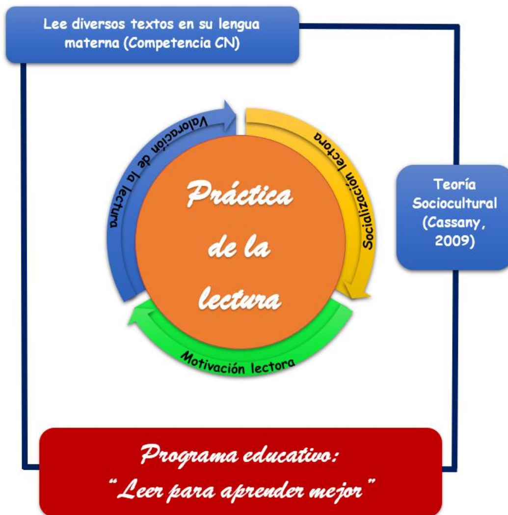
Figura 2 Modelo teórico

Finalmente, las sesiones de aprendizajes tenían como desempeños la identificación de información explícita, relevante y complementaria de los textos; inferir o predecir información de diferentes tipos de textos; opinar sobre el contenido de una información o actitudes de los personajes y explicar los valores que identificaban en los textos.